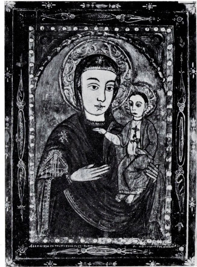
Das Gnadenbild «Maria-Pötsch» im Dom zu St. Stephan in Wien.

Diese Kapelle birgt eine in Westeuropa selten vorkommende Kopie des ungarischen Gnadenbildes «Maria-Pötsch», das im Stephansdom in Wien verehrt wird. Mit diesem Bild hat es folgende Bewandnis: Es war im letzten Viertel des 17. Jahrhunderts, da der kaiserliche Feldherr Prinz Eugen von Savoyen in berühmten Siegen den Halbmond aus Ungarn vertrieb und den Anspruch des Hauses Habsburg auf das Land des hl. Stephan — nicht zur Freude des ungarischen Adels — mit den Waffen besiegelte. Neben der Not, die die Türkenkriege über das Land